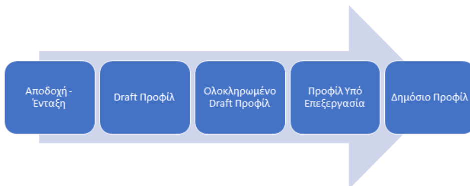
Διάγραμμα 1: Διαδικασία δημιουργίας και δημοσίευσης εταιρικού προφίλ.

Το σύστημα αρχικά δημιουργεί αυτόματα ένα κενό προφίλ για την εταιρεία και αρχικοποιεί το όνομα με το όνομα που έχει καταχωρήσει ο χρήστης στην αίτηση. Το προφίλ της εταιρείας μπαίνει σε κατάσταση draft, δηλαδή σε κατάσταση ολοκλήρωσης και παραμένει στην κατάσταση αυτή μέχρι να συμπληρωθούν όλα τα σχετικά υποχρεωτικά πεδία (βλ. πίνακας 1).