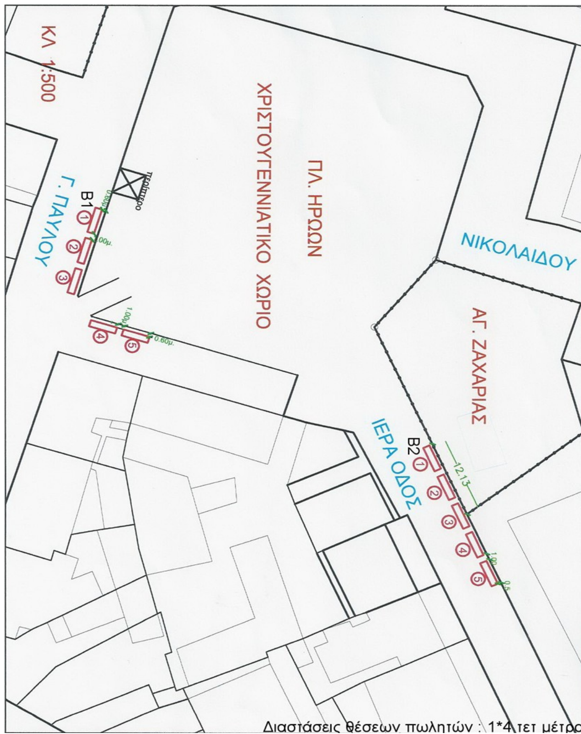
ΣΧΕΔΙΑΓΡΑΜΜΑ 2 : Πρόβλεψη και χωροθέτηση πωλητών γύρω από το Χριστουγεννιάτικο Χωριό στην Πλατεία Ηρώων, στην Ιερά Οδό και την οδό Γεωργίου Παύλου