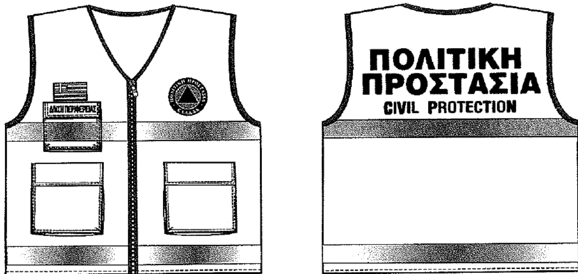
Εικόνα 2. Επιχειρησιακά γιλέκα Πολιτικής Προστασίας

Αναλυτικές προδιαγραφές για την εμφάνιση των επιχειρησιακών μπουφάν και γιλέκων Πολιτικής Προστασίας δίνονται στο 4678/22-11-2004 έγγραφο ΓΓΠΠ.