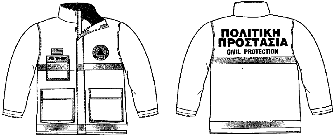
Εικόνα 1. Επιχειρησιακά μπουφάν Πολιτικής Προστασίας